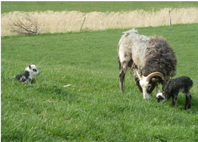
Nyfødt lam med deres mor

Nu forhandler fire af pigerne om køb af en brugt maskine, så arbejdet kan fortsættes.