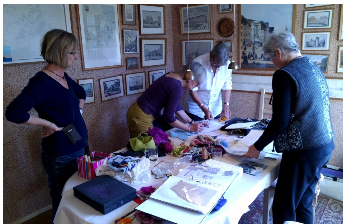
Flittige og kreative "uldpiger" på kursus.